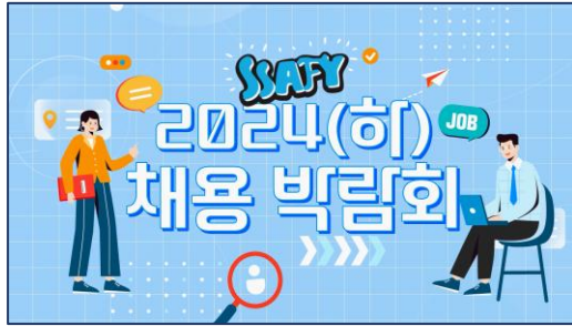
[삼성] SSAFY 행사 영상 교육·채용 브랜딩 / 인터뷰