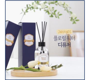
[링크로스] 플로럴워터 디퓨저 제품 후기 / 촬영·인터뷰