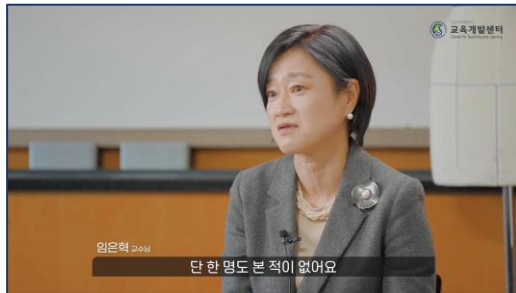
[성균관대학교] 우수 수업사례 영상 교육 사례 콘텐츠 / 인터뷰