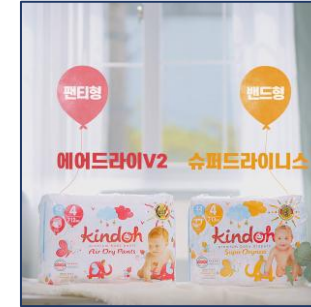
[킨도] 쿨쿨기저귀 제품 광고 / 아기모델