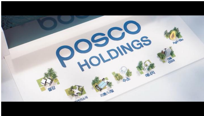
대기업 신사업 홍보

기업과 기관의 비전, 사업 가치, 조직문화를 신뢰감 있는 톤앤매너로 전달하는 브랜드 및 PR 영상입니다.