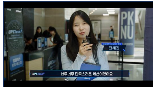
[업비트] 업클래스 행사 영상 브랜드 행사 / 현장 스케치