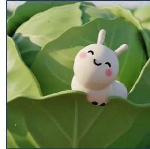
[경기도농수산물진흥원] 친환경 학교급식 공공사업 홍보 / AI 캐릭터